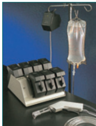
充電バッテリータイプ