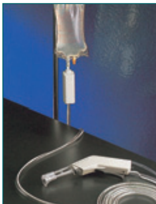
オールディスポタイプ